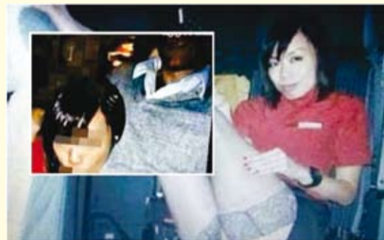
Fotos do ato sexual foram publicadas na internet.

A Cathay Pacific Airways tinha aberto uma investigação na semana passada depois que circularam fotos que mostrariam uma comissária de bordo fazendo sexo oral em um homem, que seria piloto da empresa.